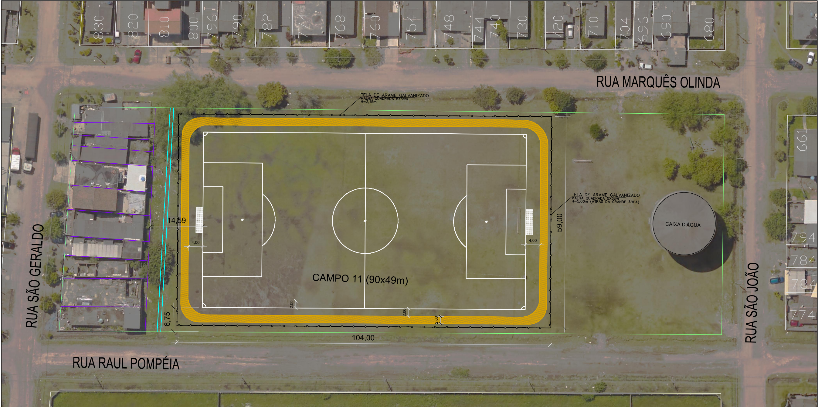
PLANTA BAIXA - IMPLANTAÇÃO - LOCALIZAÇÃO ESCALA: 1:400